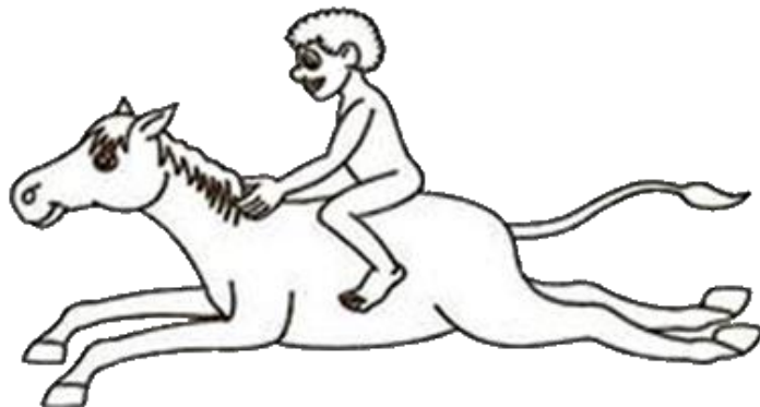
NEGRINHO DO PASTOREIRO